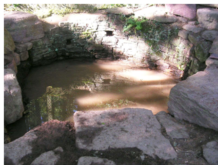
ou de la forêt de Brocéliande ?

A voir comment se portent tous nos octo- et nona-génaires, nous aurions tendance à répondre