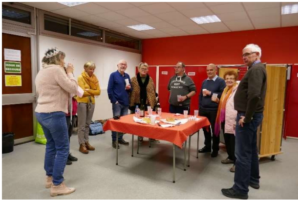
Ambiance détendue et bavardages autour du scrabble et du théâtre

Le 9 janvier, nous fêtons les rois à la maison d'animation de la Métare