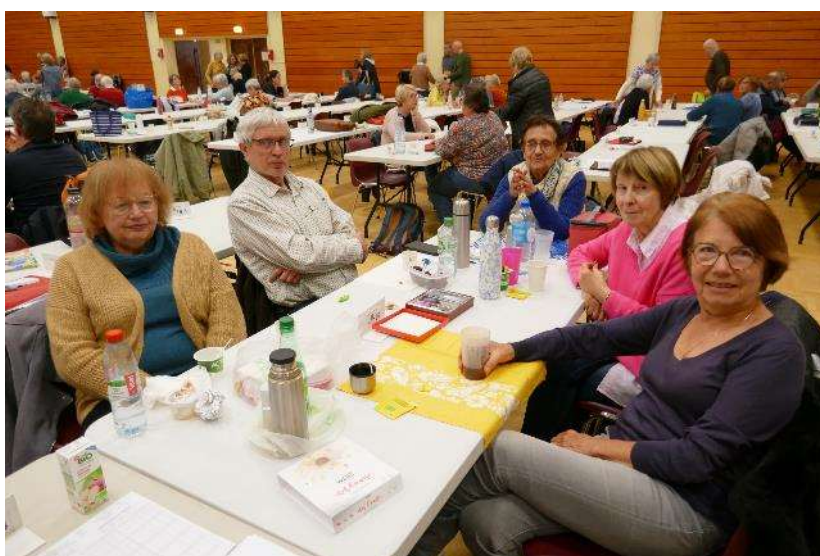
Le « Club des Cinq » à la pause repas

Nous sommes 5 du club en ce dimanche matin à être prêts à nous serrer les coudes pour faire le maximum pour la seule équipe du club présente à cette qualif. C'est peu.... mais nous allons assurer !