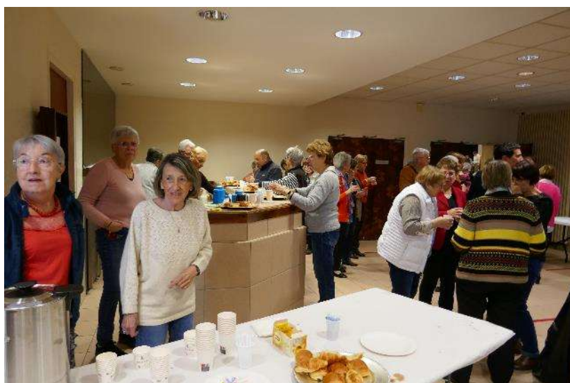
Ca papote... Ca papote !

Comme toujours, le club de Beynost nous accueille avec boissons chaudes et viennoiseries, ce qui est fort appréciable, le petit déjeuner étant déjà un peu loin.